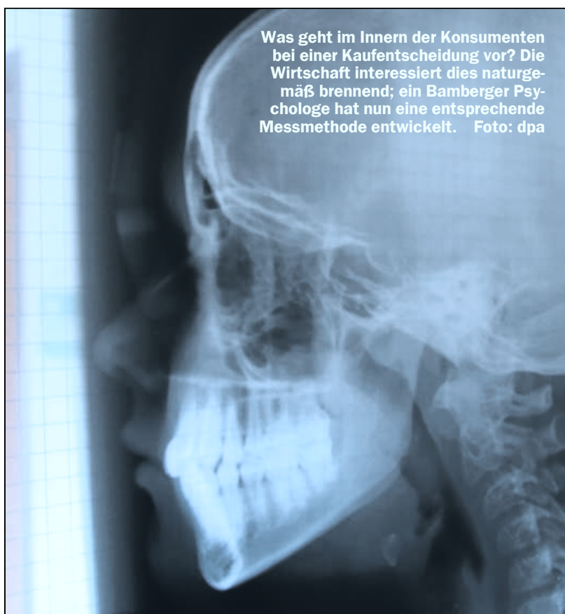
Was geht im Innern der Konsumenten bei einer Kaufentscheidung vor? Die Wirtschaft interessiert dies naturgemäß brennend; ein Bamberger Psychologe hat nun eine entsprechende Messmethode entwickelt.

gründen, welche Eigenschaften eines Produkts wirklich das Gefallen oder die Kaufbereitschaft für solch ein Produkt maßgeblich bestimmen. Meist sind diese Eigenschaften nicht direkt abfragbar, da sie dem Konsumenten selbst nicht bewusst sind. Wir gehen daher den Weg, diese über implizite Assoziationen zu erfassen, das heißt nicht direkte Produkteigenschaften abfragen, sondern bestimmte Eigenschaften mit Produkten koppeln und deren Assoziationsstärke messen.